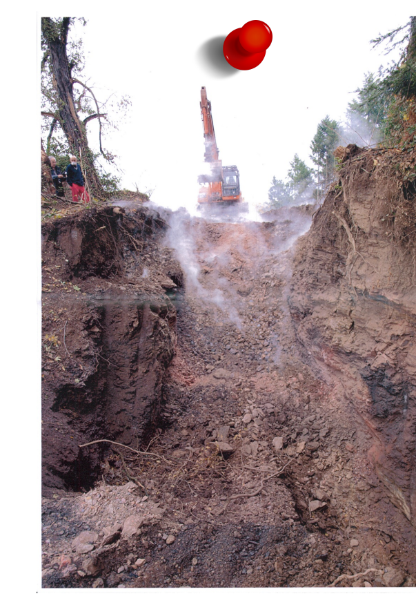
2014 - Echauffement Commune de la Talaudière