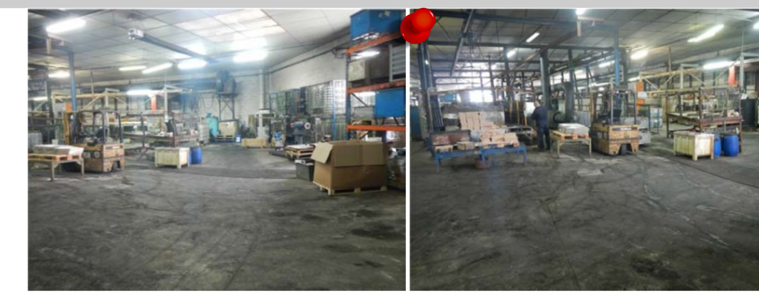
2012 - Affaissement Commune de Saint-Etienne