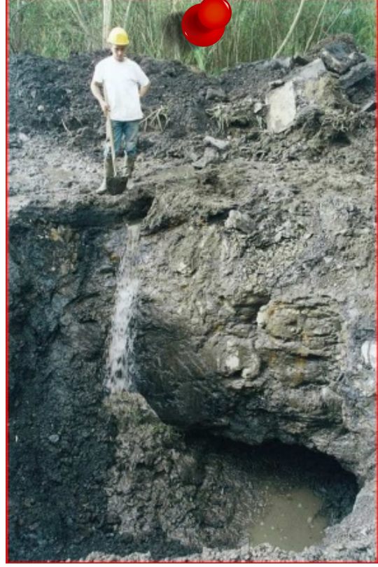
2002 - Effondrement sur travaux superficiels Commune de Roche-la-Molière