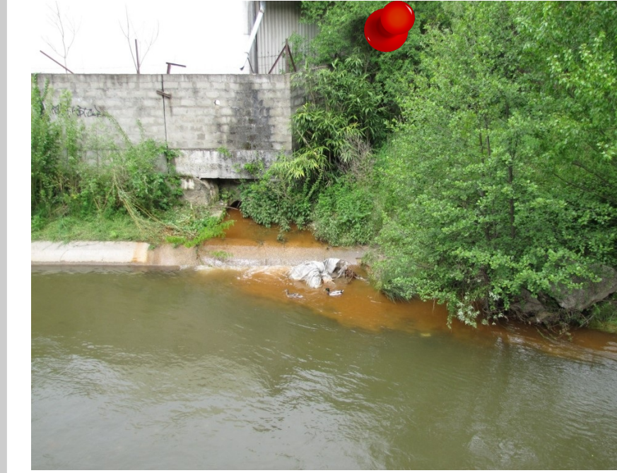
2013 - Rejet coloré orange dans le Gier Commune de Rive-de-Gier