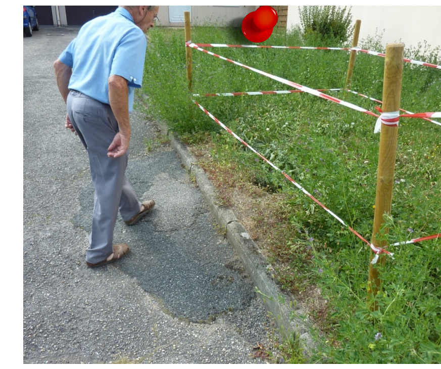
2014 - Effondrement Commune de Rive-de-Gier