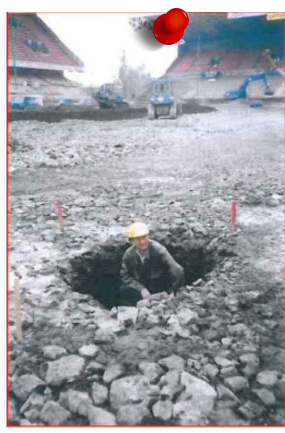
1996 - Effondrement stade Geoffroy Guichard Commune de Saint-Etienne