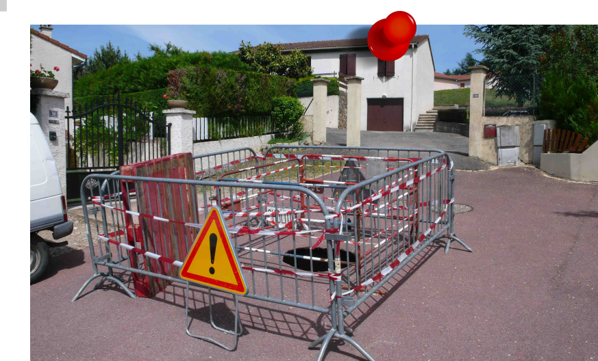
2013 - Effondrement sur chaussée Commune de Saint-Martin-la-Plaine