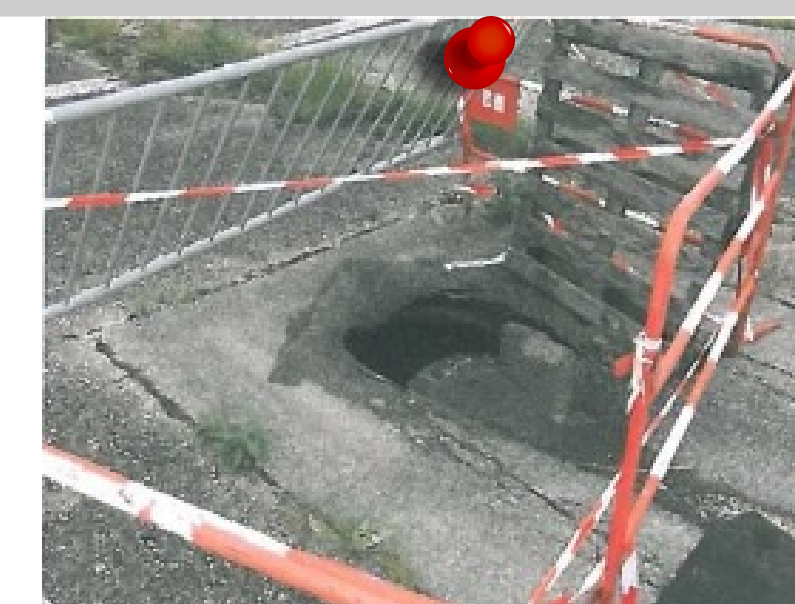
2012 - Effondrement sur galerie superficielle Commune de Firminy