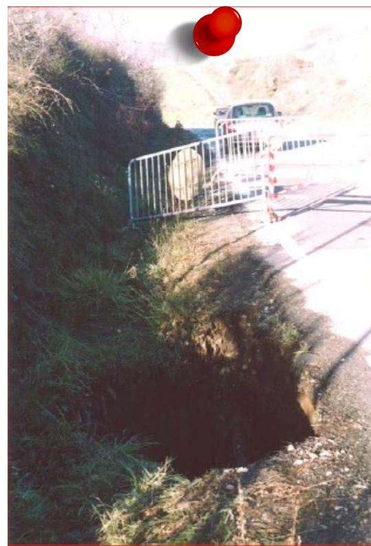
2003 - Effondrement Commune de Saint-Jean-Bonnefonds