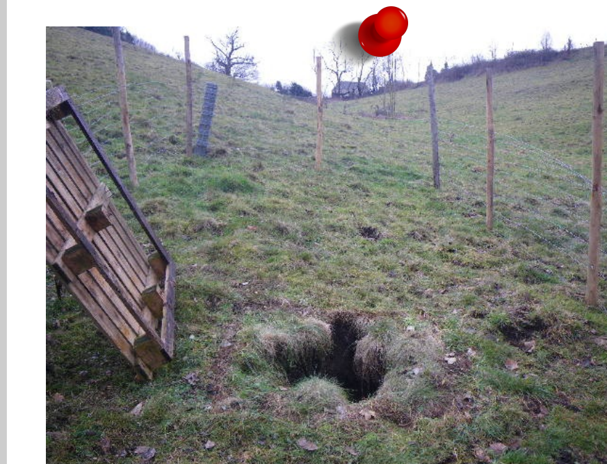
2013 - Effondrement Commune de Saint-Genest-Lerpt