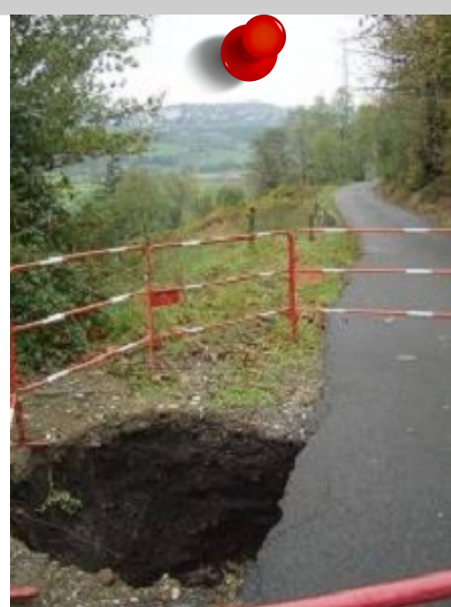
2008 - Effondrement sur galerie Commune de Saint-Genest-Lerpt