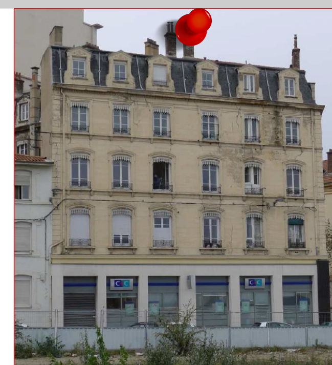
2009 - Affaissements,immeubles fissurés Commune de Saint-Etienne