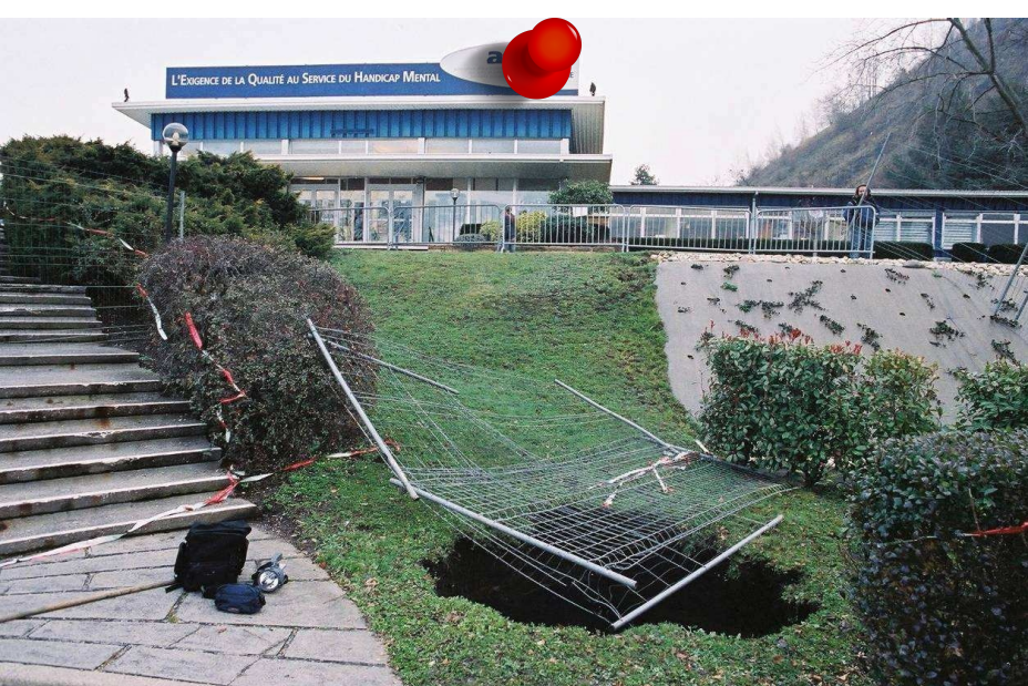
2007 - Effondrement sur site ADAPEI Commune de Saint-Etienne