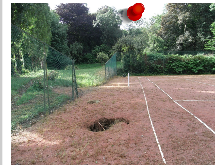
2013 - Effondrement Commune de Villars