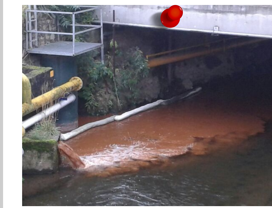
2013 - Rejet coloré orange dans l'Ondaine Commune de Firminy