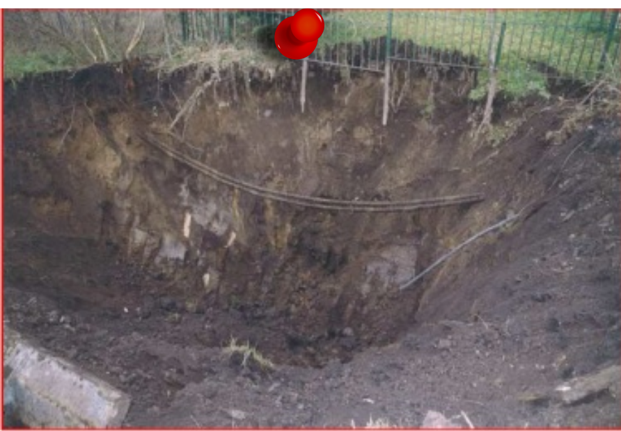
2003 - Effondrement Commune de Roche-la-Molière