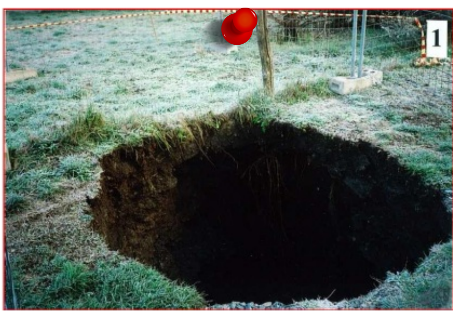
2004 - Effondrement sur travaux affleurants Commune de Saint-Chamond