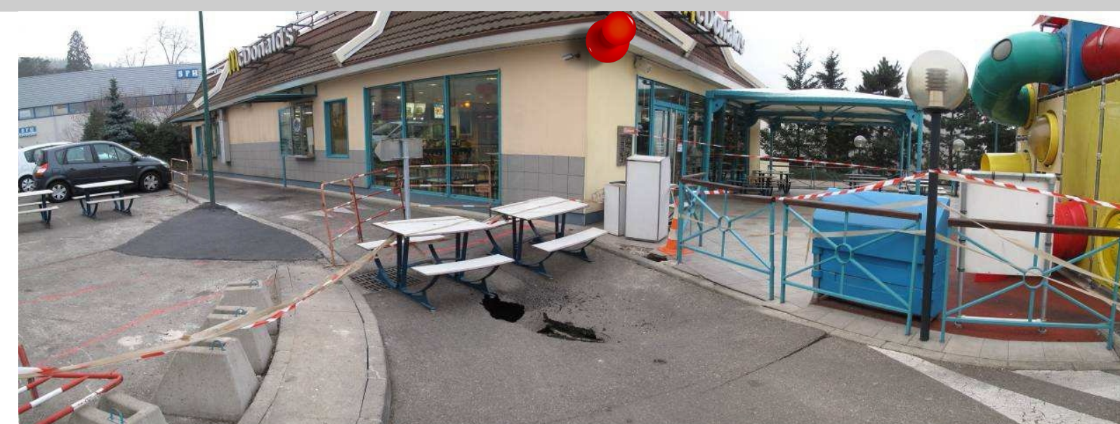
2009 - Effondrement sur site Mc Donalds Commune de Saint-Etienne