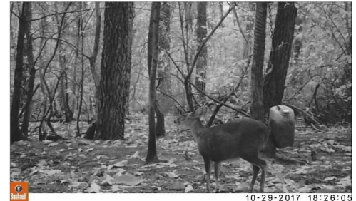
Muntjac de Reeves capturé par piège photo

Afin de prévenir un fort développement de cette population, la seule connue de France, des mesures de lutte ont été mises en œuvre sous la forme de battues administratives sans succès. L'expérience anglaise en la matière nous sera utile pour parvenir à maîtriser totalement ces animaux