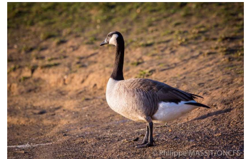
Bernache du Canada (Brandt canadensis)

Malgré ces mesures, la population de bernache poursuit sa croissance à l'échelle nationale. Depuis 2009, 6 nouveaux départements ont été colonisés par cette espèce ; le département des Ardennes présentant la plus forte augmentation d'effectifs de bernache. Les parcs urbains et bases de loisir constituent des espaces favorables pour cette espèce. Un projet de gestion intégrée dans le département des Ardennes est actuellement à l'étude avec les partenaires locaux et la Wallonie. Ce sera l'occasion de tester et mettre