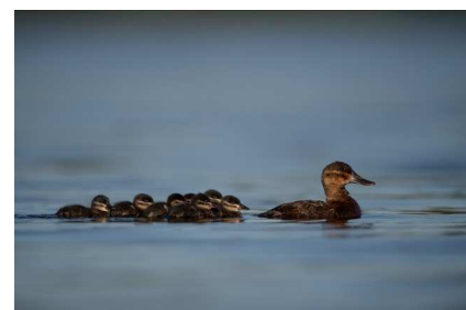
Nichée d'Erismature rousse @ E. Médard