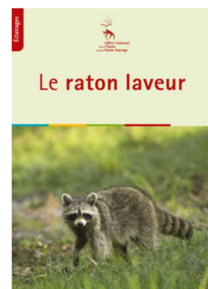
Collection éclairages : le Raton laveur