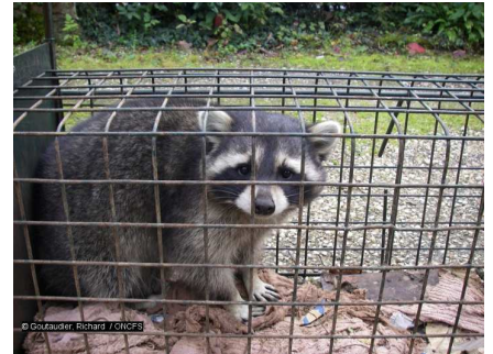
Raton laveur

également les tubercules, la banane, la canne à sucre et se sert dans les élevages de volailles. L'espèce a été récemment retirée de la liste des espèces protégées de ce département (arrêté du 17 janvier 2018).