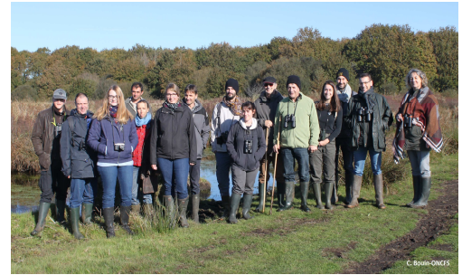
Stage 2017 en Brière

Enfin, un guide technique pour la reconnaissance de la faune exotique envahissante sur le bassin Loire, verra le jour courant 2018.