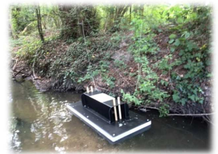
Radeau à empreinte