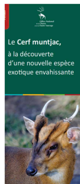
Collection focus : le Cerf muntjac