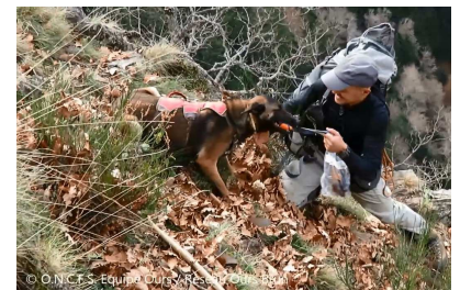
Iris et son maître

développement de cette technique pour la détection du menacé Vison d'Europe et de l'envahissant Vison d'Amérique est en test par l'ONCFS avec la chienne Iris expérimentée sur la détection de crottes d'ours.