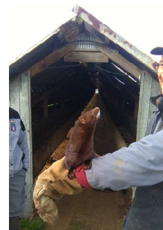
Vison d'Amérique d'élevage