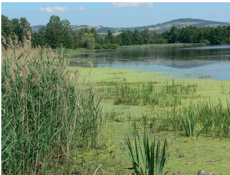
L'étang David, Saint-Just-Saint-Rambert

Cette fiche guidera vos réflexions d'élu ou de technicien sur la prise en compte des milieux aquatiques dans les documents d'urbanisme. Les mots techniques sont expliqués dans une fiche glossaire et signalés par un astérisque (*).